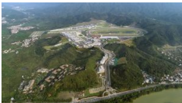
L'EDFZ de Conghua.

Pour garantir une biosécurité appropriée, il est essentiel de comprendre les mouvements d'animaux et de produits d'origine animale et d'être en mesure de les contrôler efficacement. À l'intérieur de l'EDFZ, les mouvements d'équidés domestiques, d'autres animaux et de matériel biologique sont soumis à autorisation et à des mesures de quarantaine. Pour les chevaux de course de Hong Kong passant la frontière, ces mesures de quarantaine ont été définies conjointement par le Ministère de l'agriculture de Hong Kong et par les autorités de Chine continentale, dont les services des Douanes et le Ministère de l'agriculture et des affaires rurales de la République Populaire de Chine. Une signalétique, trois checkpoints et un suivi aléatoire visant à prévenir les entrées non autorisées dans la zone centrale viennent en appui à ces mesures de quarantaine.