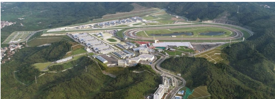
L'EDFZ de Conghua (vue partielle).

Les auteurs sont seuls responsables des opinions exprimées dans cet article. La mention de sociétés spécifiques ou de produits enregistrés par un fabricant, qu'ils soient ou non protégés par une marque, ne signifie pas que ceux-ci sont recommandés ou soutenus par l'OIE par rapport à d'autres similaires qui ne seraient pas mentionnés.