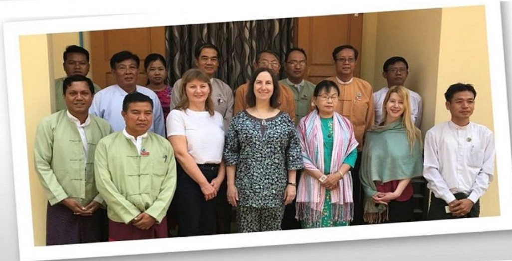
Mission d'identification de la législation vétérinaire au Myanmar, mars 2018

Et, si les experts qui conduisent cette mission initiale jugent que le pays dispose d'une volonté politique et de ressources humaines et financières suffisantes (facteurs essentiels de succès), le PALV peut ensuite se poursuivre