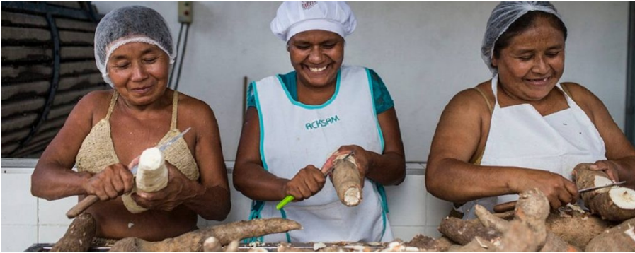
Comunidad indígena Kirirí en Marcação (Brasil).