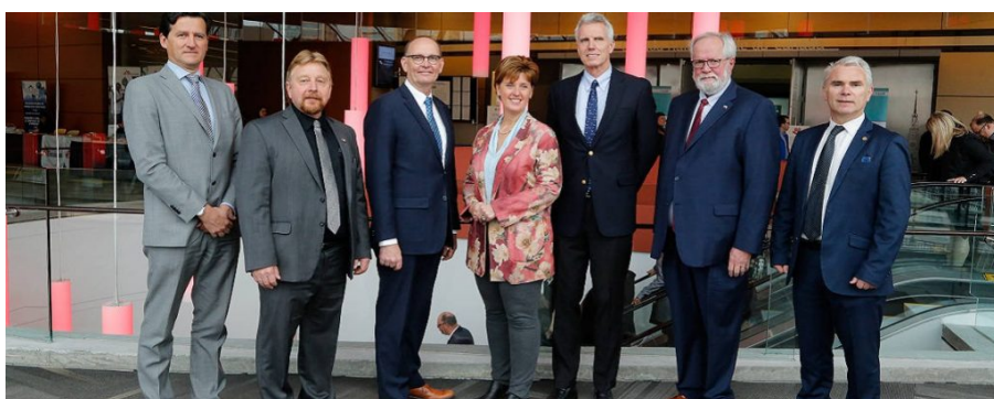
Foro sobre la peste porcina africana, Ottawa, Canadá, 30 de abril y 1 de mayo de 2019.

La responsabilidad de las opiniones profesadas en este artículo incumbe exclusivamente a sus autores. La mención de empresas particulares o de productos manufacturados, sean o no patentados, ni implica de ningún modo que éstos se beneficien del apoyo o de la recomendación de la OIE, en comparación con otros similares que no hayan sido mencionados.