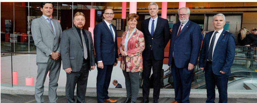
Foro sobre la peste porcina africana, Ottawa, Canadá, 30 de abril y 1 de mayo de 2019.

La responsabilidad de las opiniones profesadas en este artículo incumbe exclusivamente a sus autores. La mención de empresas particulares o de productos manufacturados, sean o no patentados, ni implica de ningún modo que éstos se beneficien del apoyo o de la recomendación de la OIE, en comparación con otros similares que no hayan sido mencionados.