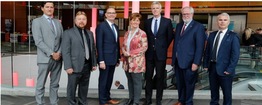
Foro sobre la peste porcina africana, Ottawa, Canadá, 30 de abril y 1 de mayo de 2019.

La responsabilidad de las opiniones profesadas en este artículo incumbe exclusivamente a sus autores. La mención de empresas particulares o de productos manufacturados, sean o no patentados, ni implica de ningún modo que éstos se beneficien del apoyo o de la recomendación de la OIE, en comparación con otros similares que no hayan sido mencionados.