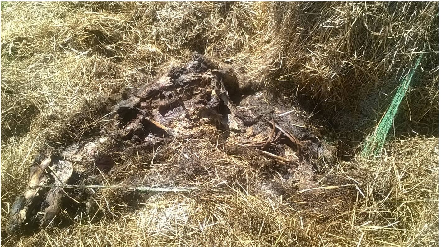
Fig. 2. Paille contaminée par un cadavre de sanglier.