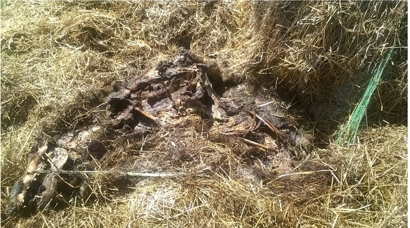
Fig. 2. Paille contaminée par un cadavre de sanglier.