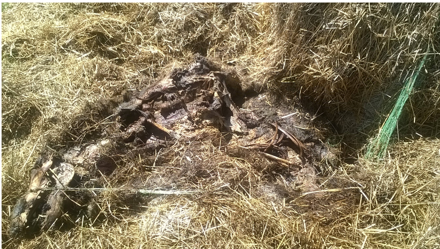
Fig. 2. Paille contaminée par un cadavre de sanglier.