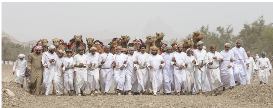
Hombres omaníes caminando y bailando tras una tradicional carrera de camellos.

La responsabilidad de las opiniones profesadas en este artículo incumbe exclusivamente a sus autores. La mención de empresas particulares o de productos manufacturados, sean o no patentados, ni implica de ningún modo que éstos se beneficien del apoyo o de la recomendación de la OIE, en comparación con otros similares que no hayan sido mencionados.