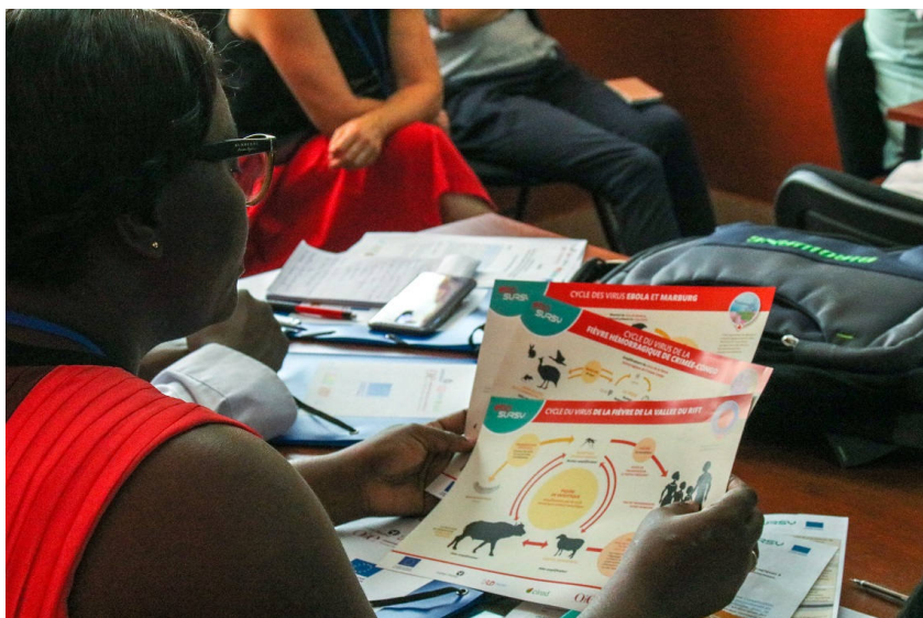
Utilisation d'outils techniques pédagogiques lors d'une formation «Une seule santé».

Un autre exemple phare des nouvelles activités de l'OMSA dans le domaine de la santé de la faune sauvage est le Projet de renforcement des capacités et de surveillance des fièvres hémorragiques virales ( EBO-SURSY ), qui vise à améliorer les systèmes de détection précoce chez les animaux sauvages d'Afrique occidentale et d'Afrique centrale afin de prévenir les foyers de maladie à virus Ebola et de quatre autres fièvres hémorragiques virales.