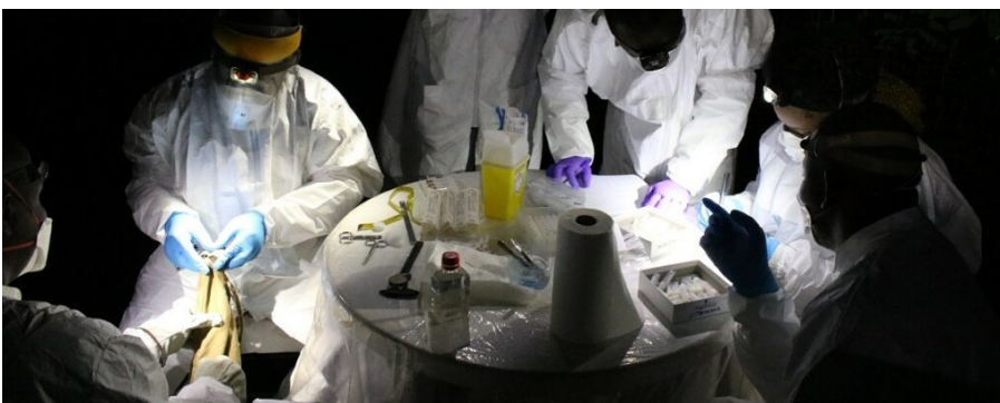
Formation sur le terrain (capture de chauves-souris et prélèvements) lors de la formation «Une seule santé» en Guinée.