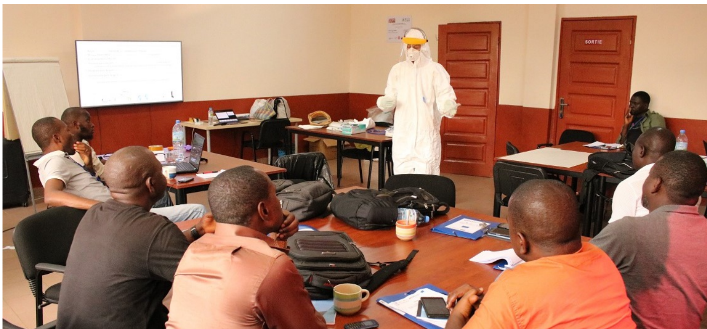
Formation en biosécurité et biosûreté pour la réalisation de prélèvements dans la faune sauvage (chauves-souris) lors d'une formation «Une seule santé» en Guinée.