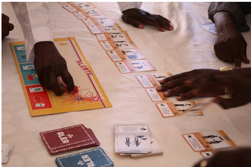
« Alerte », un jeu de société à visée pédagogique.

qu'au laboratoire. Ce programme devrait renforcer les compétences des futurs professionnels de la santé animale et accroître la capacité des institutions nationales à consolider leurs systèmes de surveillance. Une évaluation des effets sur long terme de ces initiatives de formation a été systématiquement réalisée.