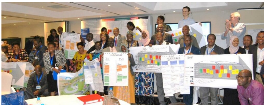
Atelier national RSI/PVS en Tanzanie.