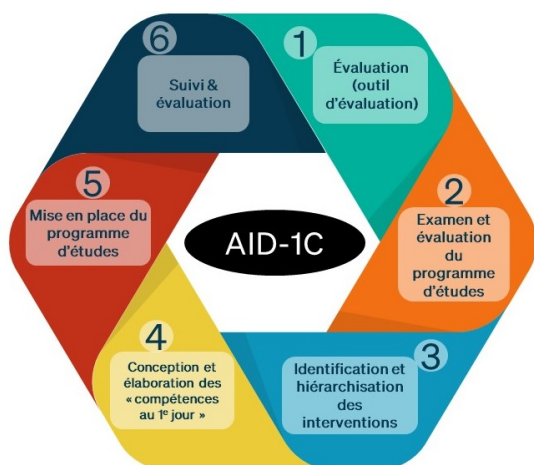
Évaluation et mise en place des « compétences au premier jour ». Le modèle AID-1C