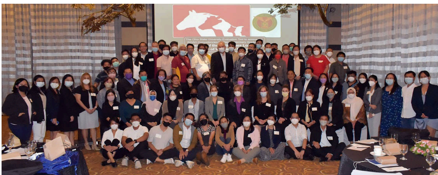
Participants et observateurs de l'atelier d'évaluation du programme d'enseignement de l'Université des Philippines Los Baños.

Au Cambodge (11–13 octobre) , 53 participants ont évalué le programme d'enseignement de la RUA. Afin de répondre aux besoins et aux préférences de l'institution chargée de la mise en œuvre, l'Outil d'évaluation a été traduit en langue