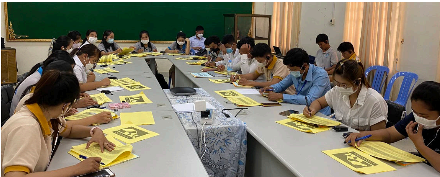
Rencontre-débat avec des étudiants en formation à l'Université royale d'Agriculture (Cambodge) visant à recueillir leurs contributions.

khmère et réalisé au moyen de formulaires papier (illustrés). Un participant à l'atelier de la RUA a commenté : « Cet atelier est vraiment bien fait et utile pour le développement des capacités de la médecine vétérinaire au Cambodge ».