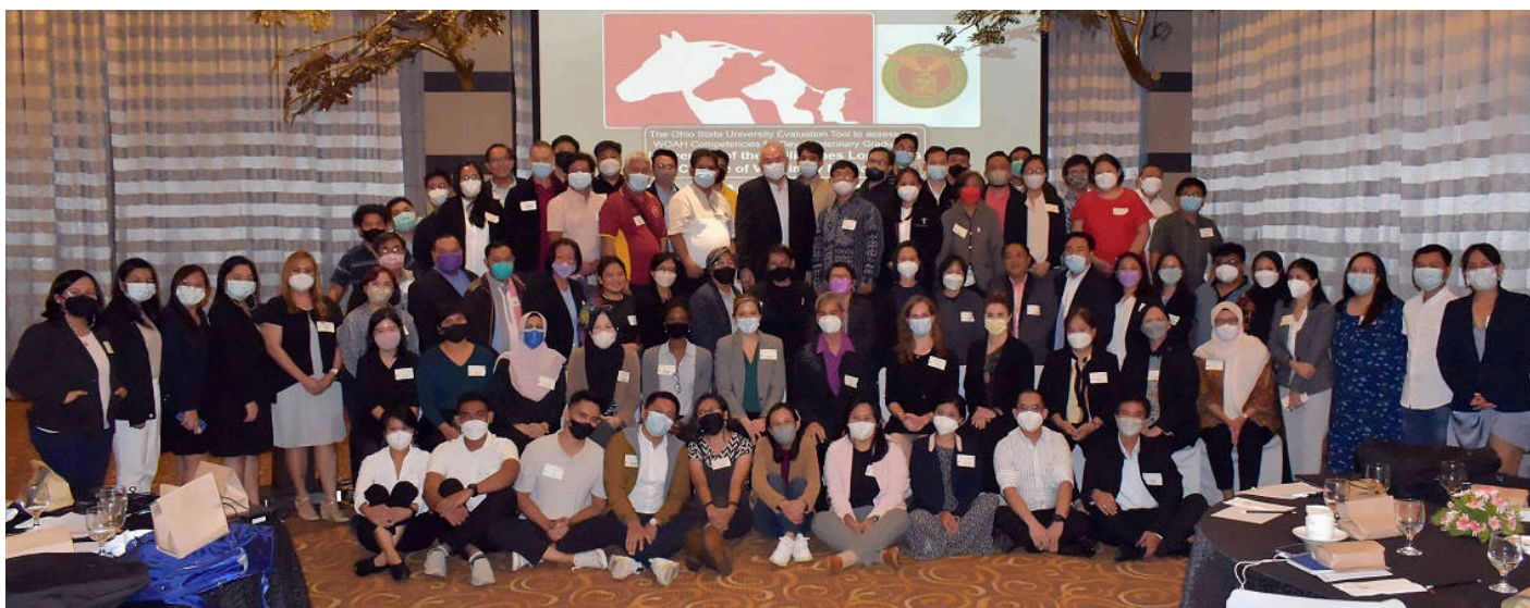
Participants et observateurs de l'atelier d'évaluation du programme d'enseignement de l'Université des Philippines Los Baños.

Au Cambodge (11–13 octobre) , 53 participants ont évalué le programme d'enseignement de la RUA. Afin de répondre aux besoins et aux préférences de l'institution chargée de la mise en œuvre, l'Outil d'évaluation a été traduit en langue