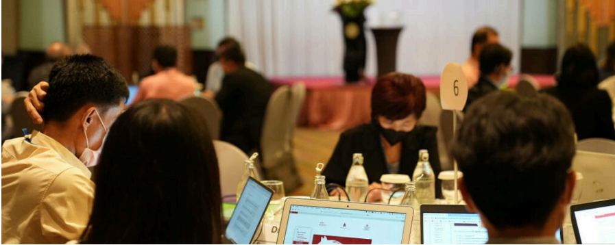
Participants de l'atelier d'évaluation du programme d'enseignement de l'Université Khon Kaen (Thaïlande) remplissant le formulaire de l'outil d'évaluation en ligne.

fabricant, qu'ils soient ou non protégés par une marque, ne signifie pas que ceux-ci sont recommandés ou soutenus par l'OMSA par rapport à d'autres similaires qui ne seraient pas mentionnés.