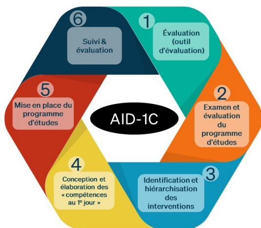
Évaluation et mise en place des « compétences au premier jour ». Le modèle AID-1C