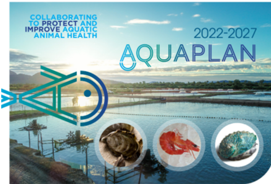
Photo 1: Aquaplan 2022-2027

https://doi.org/10.20506/bull.2023.2.3424