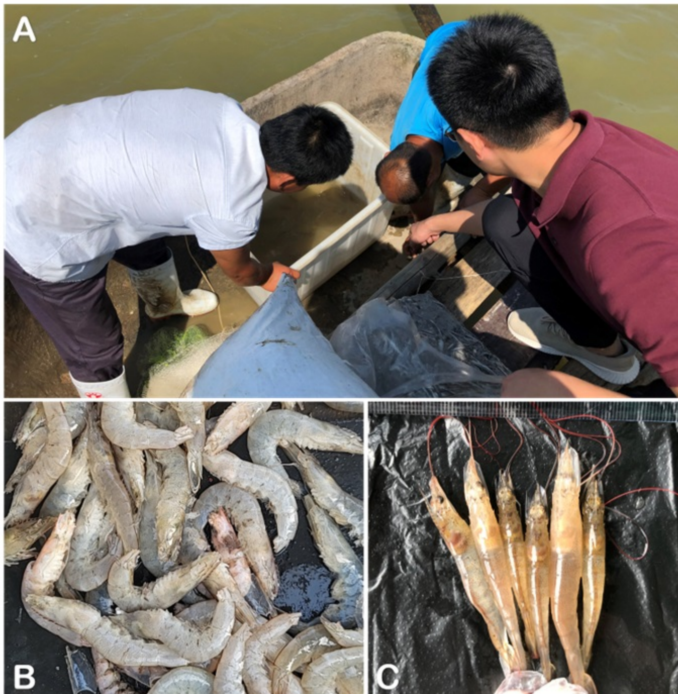
Figura 1. Investigación epidemiológica y recogida de muestras de gambas de cultivo