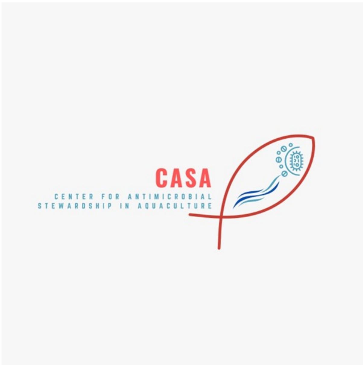
Foto 1: Logo Center for Antimicrobial Stewardship in Aquaculture, © Center for Antimicrobial Stewardship in Aquaculture