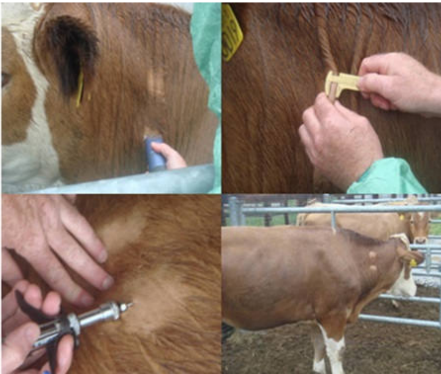
Fig. 1. Prueba al ganado: rapar zonas en la mitad del cuello; medir el espesor de la piel; inyectar la tuberculina – de aves y bovinos; 72 horas después, medir y comparar respuestas [2, 3].

tuberculosis zoonótica en el ser humano [4] ahora son poco frecuentes.